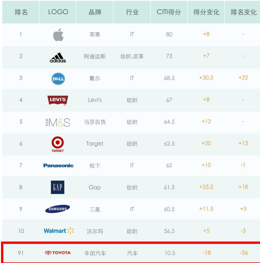
（2016 年品牌 CITI 指数得分与排名变化，IPE 制图）

高调的环保宣传虽然有助于品牌价值的提升，但此前丰田长时间沉默应对在华供应商环境违规，使其环保宣传大打折扣。在 2016 年企业环境信息公开指数（CITI）评价中，丰田汽车的得分和排名显著下滑，几乎跌出前 100 名。